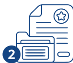
2 Документтерди даярдоо