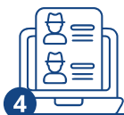
4 Документтерди тапшыруу