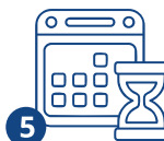
5 Патент алуу