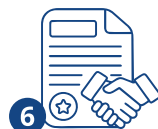
6 Жумушка алуу