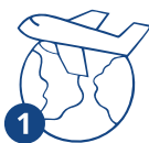
1 Россияга келүү

Ишке патенттин мөөнөтү 12 айга чейин чектелген. Төлөм патент жарактуу болгон ар бир ай үчүн жүргүзүлөт. Эгер патентти убагында төлөбөсөңүз – ал күчүн жоготот!