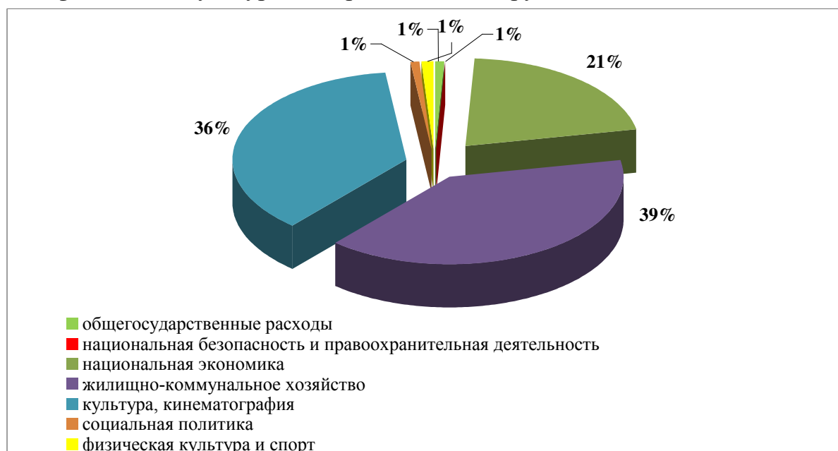
Рисунок 3. Структура расходов по отраслям бюджетной классификации бюджета муниципального образования «Чердаклинское городское поселение» Чердаклинского района Ульяновской области в 2019 году, %.